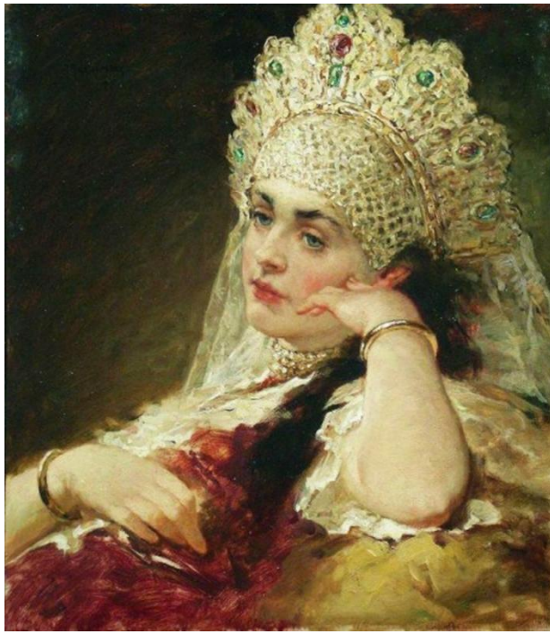
художник Маковский К.Е.

Головные уборы были с открытым верхом, расшитые золотой нитью, а на лоб спускались под низ ажурного плетения из жемчуга (в виде сетки). Жемчуг добывали в чистых северных реках.